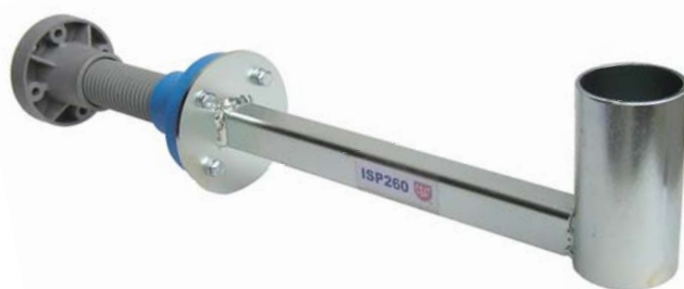
ISP100 + ISP260N

portfólio konzol ISP CSAT pre ISP základné sady : ISP125N, ISP140N, ISP230N, ISP260N