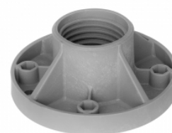
spodná časť ISP100

materiál : Fibremod™ GB364WG (polypropylén obsahujúci sklenené vlákna)